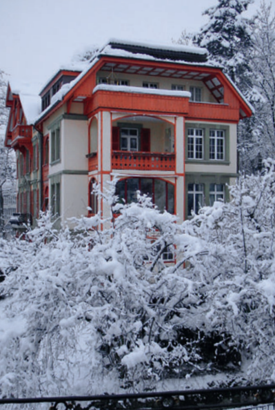
Nicht nur im Winter eine Pracht: das ITSA-Gebäude am Pavillonweg 14 in Bern